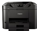
MAXIFY MB5150 Modelle