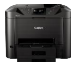
MAXIFY MB5450 Modelle