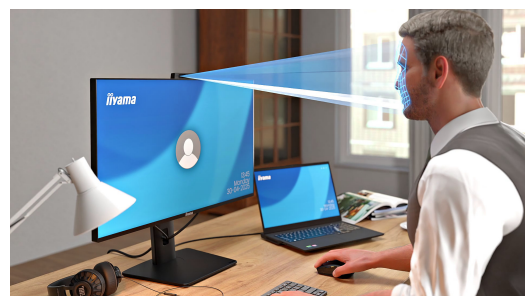
Einfacher Zugang mit Windows Hello-Kamera

Wechseln Sie mühelos zwischen mehreren Computern mit nur einem Monitor, einer Tastatur und einer Maus – für reibungsloses und effizientes Multitasking.