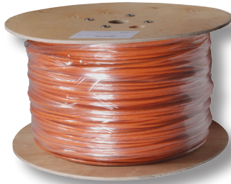
500/1000 m Trommel